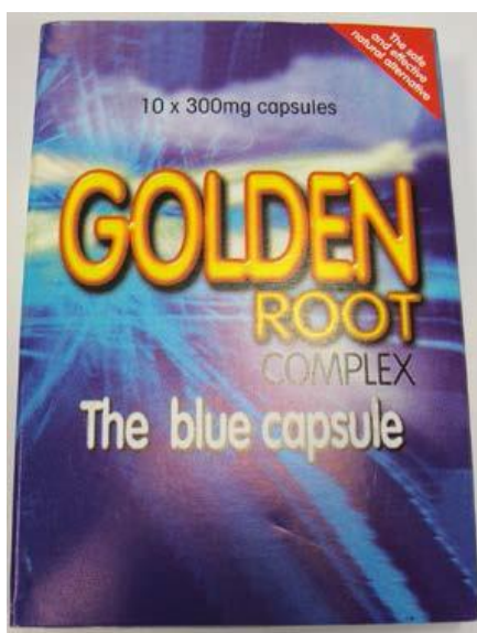
PRODUCTO GOLDEN ROOT

La COFEPRIS informa a la población de los productos Herbal Sex Pill cápsulas , Golden Root Complex cápsulas , Seduce Me cápsulas que son comercializados como suplementos alimenticios, están siendo retirados por la Agencia Española de Medicamentos y Productos Sanitarios, ya que contienen principios Activos Sildenafil y Tadalafil