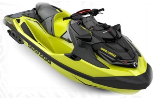
WAKE PRO 230