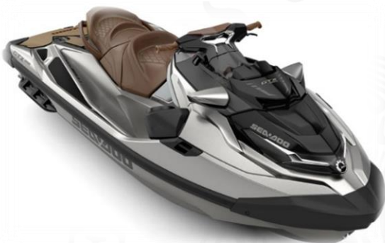
GTX LTD 230 y 300