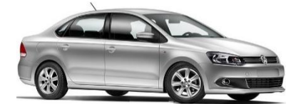
MARCA: VOLKSWAGEN MODELO: VENTO AÑOS: 2014 UNIDADES INVOLUCRADAS: 41,790