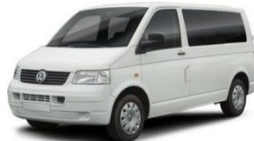
MARCA: VOLKSWAGEN MODELO: EUROVAN AÑOS: 2008 - 2009 UNIDADES INVOLUCRADAS: 5,218