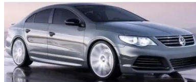
MARCA: VOLKSWAGEN MODELO: PASSAT AÑOS: 2008 2009 2010 UNIDADES INVOLUCRADAS: 5,704