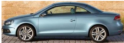
MARCA: VOLKSWAGEN MODELO: EOS AÑOS: 2010 UNIDADES INVOLUCRADAS: 211